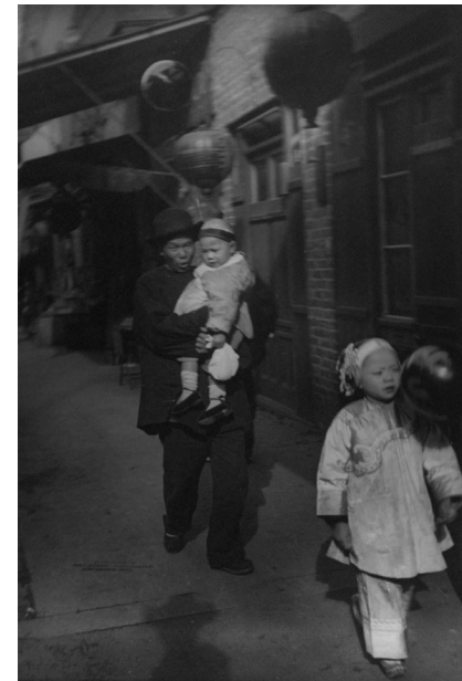
Arnold Gente, Praznična poseta, 1895-1908, srebro-želatinski postupak, Digitalna kolekcija Muzeja Metropolitena, Njujork

Interesovanjem za svakodnevne motive i situacije, a bez pretenzija da budu estetski privlačne već isključivo realne, fotografije Luisa Hajna, Jakoba A. Rijsa, Ežena Atžea i drugih autora postavile su temelje moderne dokumentarne fotografije i značajno uticale na naredne generacije fotografa.