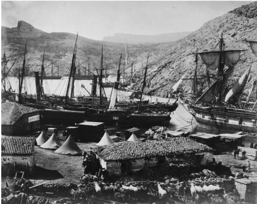
Rodžer Fenton, Luka Balaklava , 1855, otisak sa staklenog negativna na slanom papiru, Digitalna kolekcija Muzeja Metropolitena, Njujork