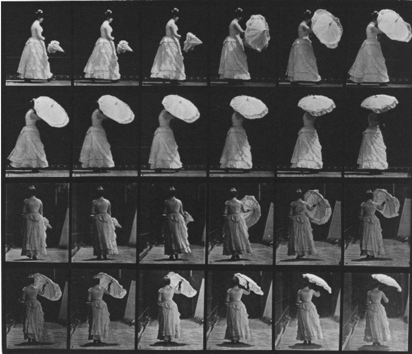
Edvard Majbridž, Žena otvara suncobran , 1883–1886, Digitalna kolekcija Muzeja Metropolitena, Njujork