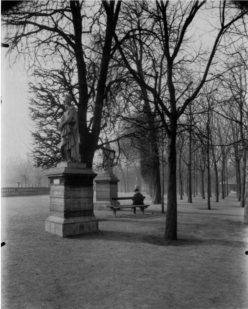
Ežen Atže, Luksemburški vrt , 1902, srebro-želatinski postupak