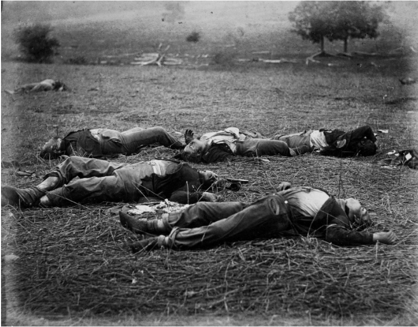
Timoti O'Saliven, Polje gde je pao general Reynolds, Žetva smrti , bitka kod Getisburga, 1863, otisak sa staklenog negativna na albuminskom papiru, Digitalna kolekcija Muzeja Dž. Pol Geti.

na Brodveju u Njujorku u koji su navraćali vodeći predstavnici političkih i kulturnih krugova. Godine 1850. objavio je seriju fotografija pod nazivom Galerija slavnih Amerikanaca ( The Gallery of Illustrious Americans ), a 1851. na izložbi u Kristalnoj palati u Londonu njegove dagerotipije su proglašene najboljim. U njegove najbolje portretne fotografije spada portret Abrahama Linkolna iz 1860. godine. Poznanstva i portreti slavnih su mu donekle i omogućili mesto ratnog fotografa. Prve ratne fotografije je uradio tokom bitke kod Bul Rana. Sve do završetka rata Brejdi je s grupom asistenata uradio na hiljade fotografija s prikazima gradskih ruševina, leševa vojnika na bojnopolju, ranjenika, artiljerije, vojničkih logora, mostova i pruga. Jedino mu nije pošlo za rukom da fotografiše samu bitku. Broj i raznovrsnost snimaka nisu samo Brejdijeva zasluga