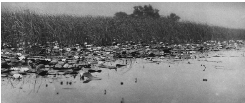
Piter Henri Emerson, Lokvanji , 1886, platinotipija, Digitalna kolekcija Muzeja Metropolitena, Njujork

„Dani odmora su Kodakovi dani“. Ispod nekih od njih su često išli tekstovi o upotrebi „Kodakovih“ aparata u gotovo svim prilikama. Iako su oglasi i slogani bili namenjeni ljudima različitih profesija i interesovanja, sve njih je pratila fotografija ili crtež sa „Kodak-devojkom“. Prvi put se pojavila na fotografiji iz 1893. godine i po istraživačima fotografije personifikovala je slobodnog amatera. Godine 1900. godine „Kodak“ je pustio na tržište još jedan poznat i po ceni pristupačan model „boks brauni (Box Brauni), koji je tokom prve polovine XX veka nastavio da se usavršava. Zahvaljujući dimenzijama i sistemu funkcionisanja ovaj model je kao i prvi „Kodakov“ foto-aparat svako mogao da koristi, čak i deca.