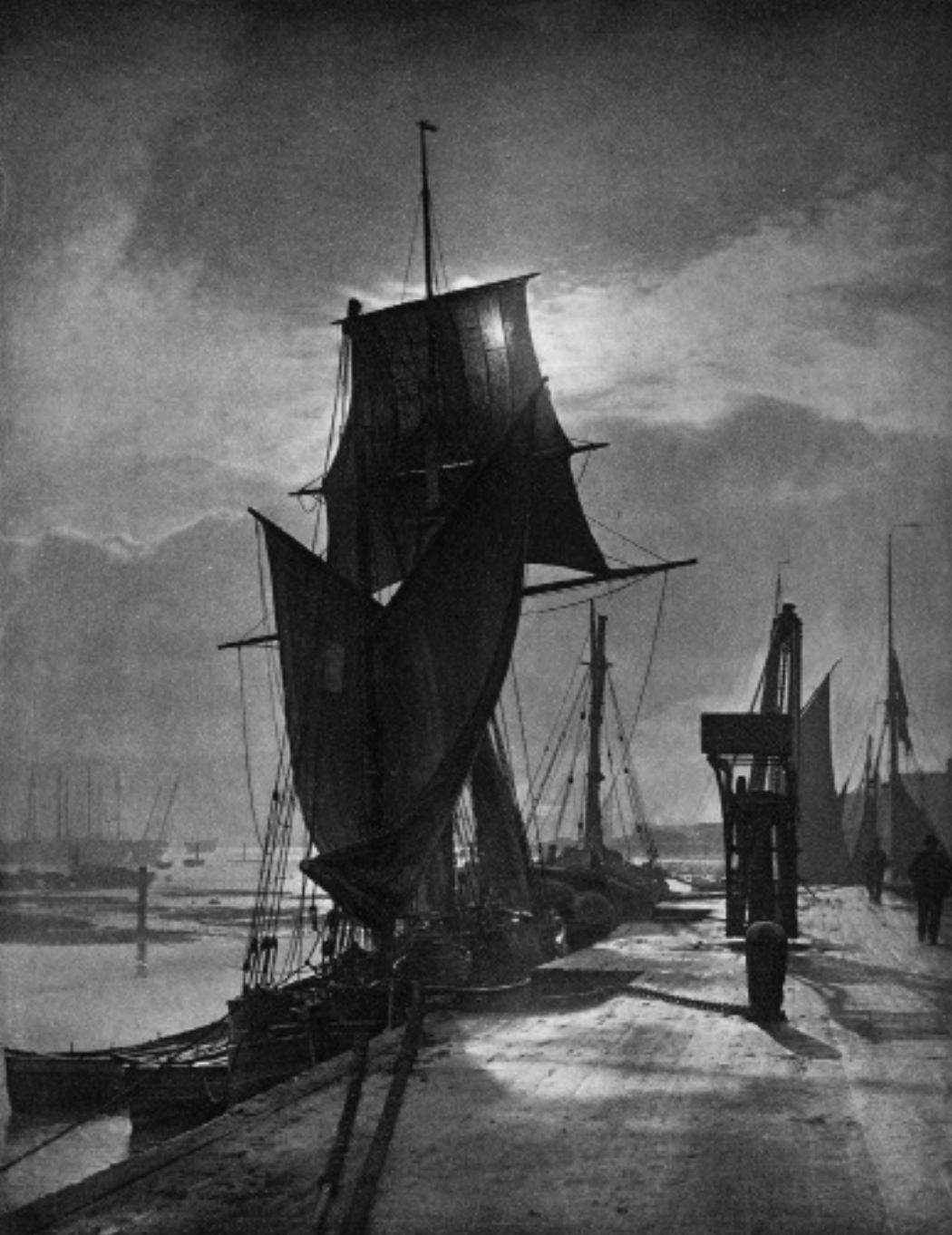
Frenk Medov Satklif, Sunce i pljusak , 1889–1891, fotografura, Digitalna kolekcija Muzeja umetnosti, Los Anđeles