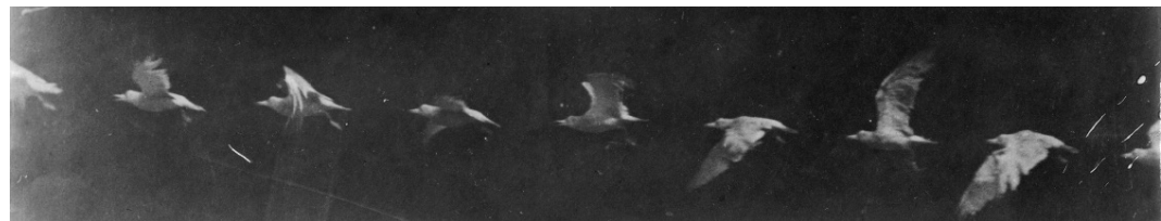
Žil-Etjen Marej, Ptica u letu , 1886, otisak sa staklenog negativna na albuminskom papiru, Digitalna kolekcija Muzeja Metropolitana, Njujork

Majbridžove fotografije su savremenom tehnologijom danas pretvorene u animacije i dostupne su na internetu.