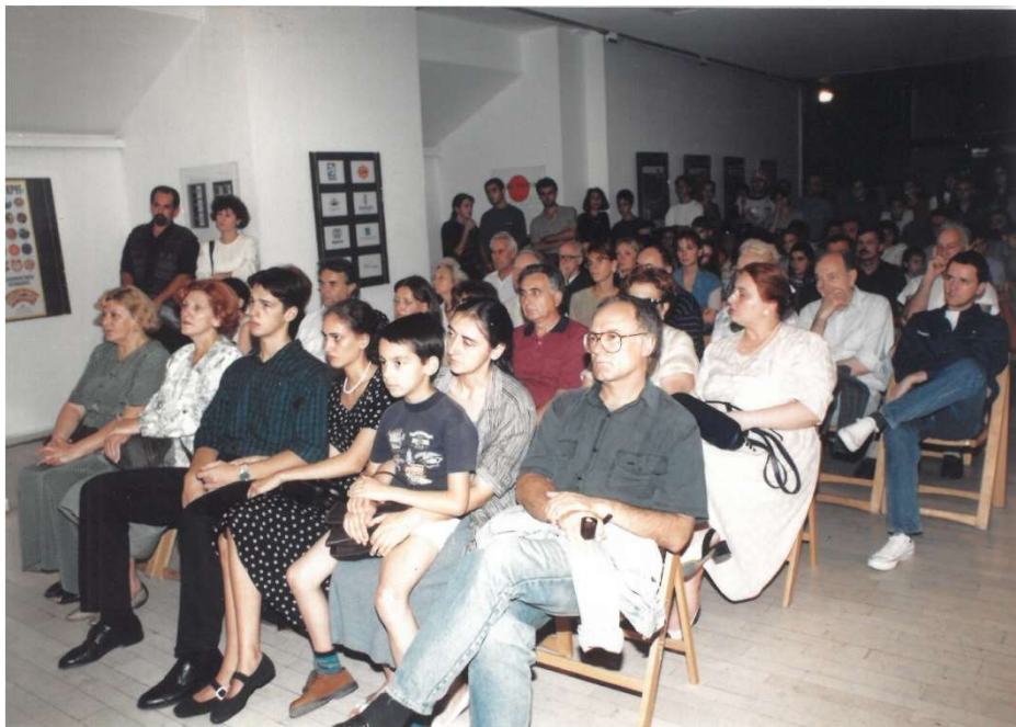
Неизоставан део музичког програма увек је била наша публика (фотографија са отварања фестивала Флаута увек и свуда , 21. август 1995)