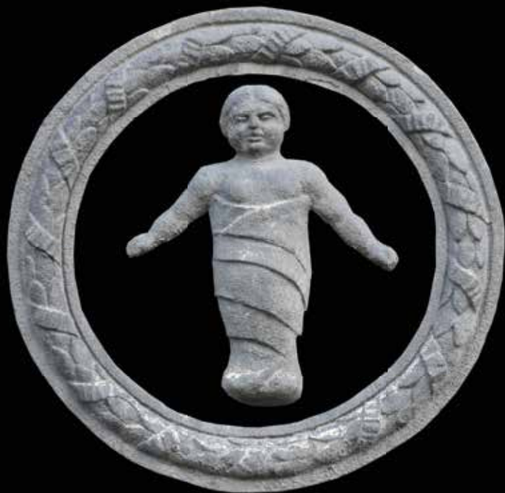
Miloša Pocerca 6 Zgrada prvog dečijeg obdaništa podignuta je 1928. Projektovao je arh. Jan Dubovi Autor reljefa je nepoznat Reljef je od veštačkog kamena