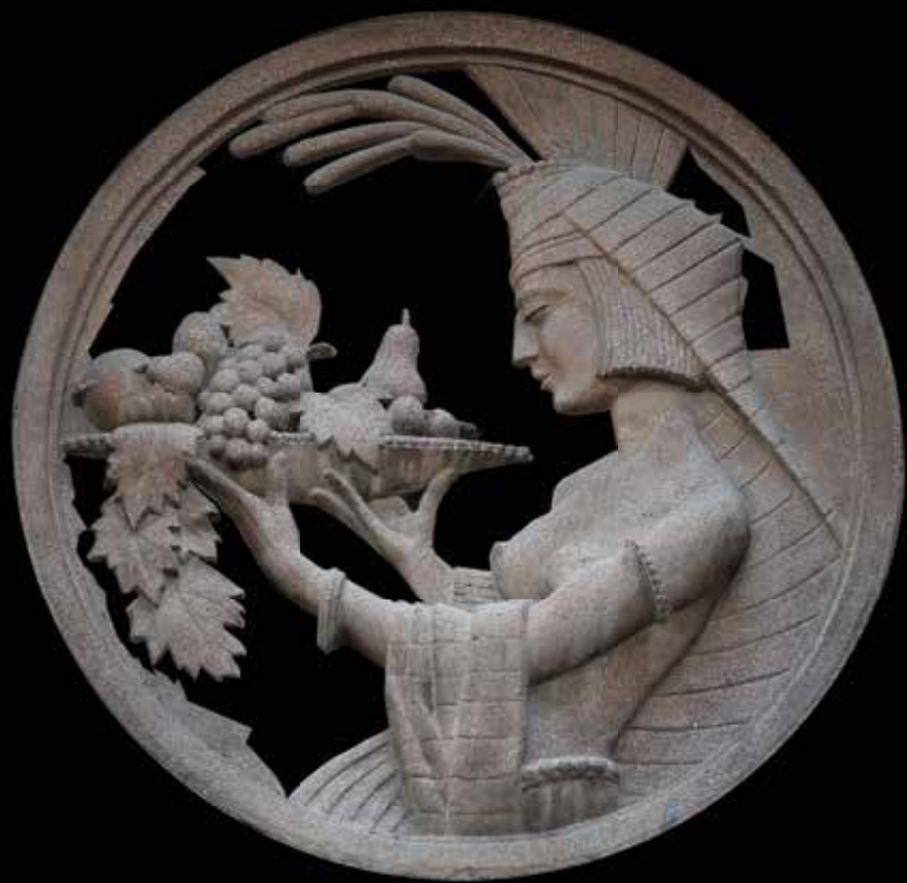
Stojana Protića 6 Zgrada je podignuta 1936. Projektovao je arh. Pavle Aleksić Autor reljefa je likorezac Aca Stojanović Reljef je izvedeni livenjem veštačkog kamena u kalup i umnožavani